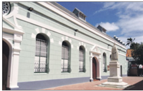
De Santa Anakerk, het pijporgel en het interieur van de Santa Anakerk.